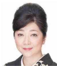
ふじもとあきこ 藤本昭子

東京藝術大学卒。1975年同大講師を勤める。86年から文化庁芸術祭賞を3回受賞。2000年富山清琴を襲名し生田流清音家元を継承。04年日本芸術院賞受賞、09年重要無形文化財保持者(人間国宝)認定、11年紫綬褒章受賞。